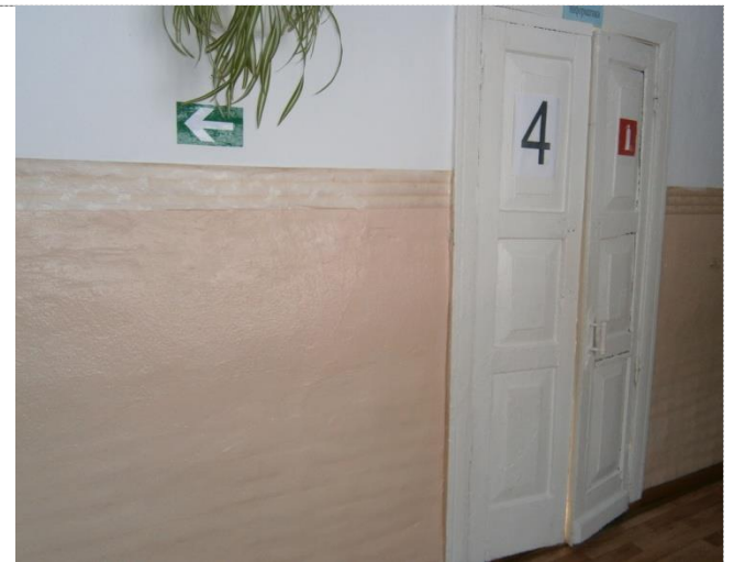
Фото №4 – Зона оказания услуг (кабинетная форма)