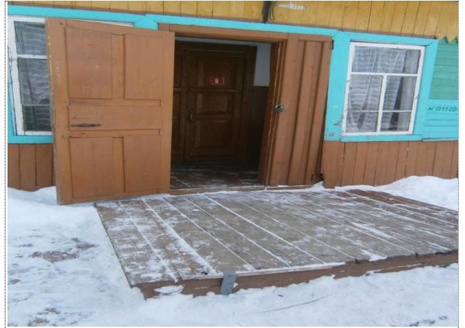
Фото №2 – Вход в здание