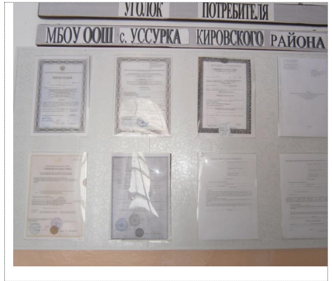
Фото №8 – Система информации на объекте