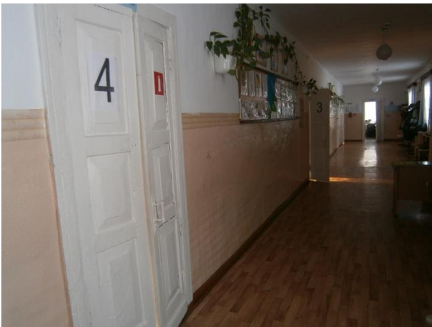
Фото №3 – Пути движения внутри здания