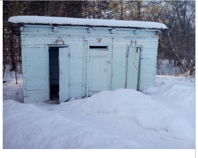
Фото №6 – Санитарно-гигиенические помещения. Надворный туалет.