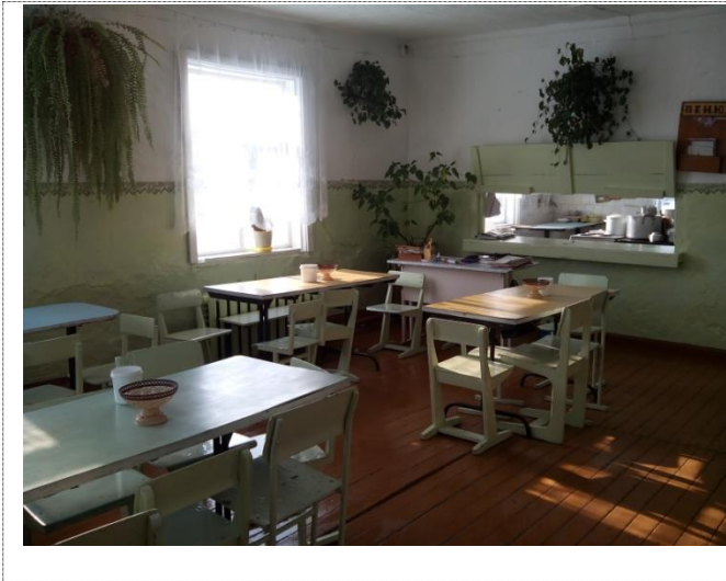
Фото №5 – Зона оказания услуг (зальная форма). Столовая