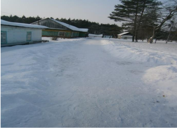
Фото №1—Прилегающая территория